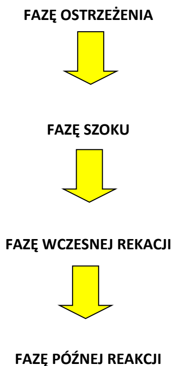
Rysunek 2. Fazy emocjonalnej reakcji na kryzys

Wyróżniamy cztery fazy emocjonalnej reakcji na kryzys (Ugur, 2012).